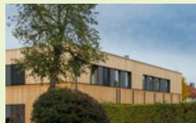
Landsberg am Lech