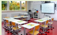
Carl-August-Heckscher-Schule Sieben Standorte, davon zwei in München